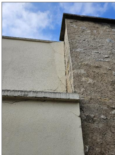
Côté rue des Grands Prés

Dès octobre 2024, le trottoir rue des Grands Prés longeant la propriété communale Aigue Flore avait été neutralisé pour cause de danger imminent vu la dégradation du mur de clôture de l'espace technique communal.