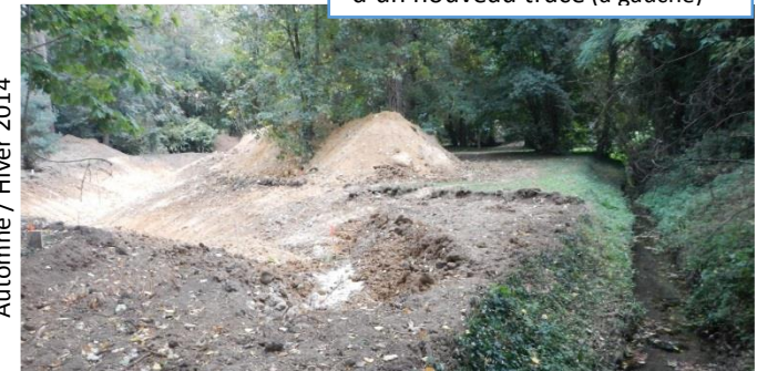
Pendant travaux : création d'un nouveau tracé (à gauche)