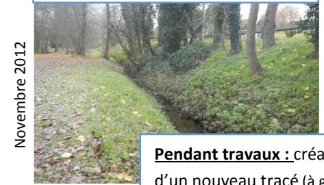
Avant travaux : ancien lit linéaire

Reméandrage du ru des Godets dans le parc de la Noisette à Verrières-le-Buisson (91) et Antony (92).