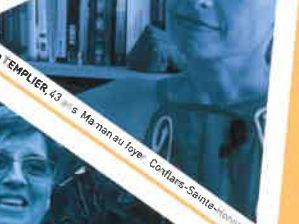
Jocelyne TEMPLIER, 43 ans, Mécanicien au foyer, Conflans-Sainte-Hippolyte